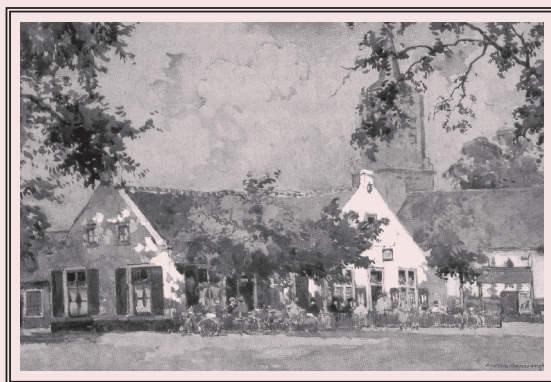
AQUAREL Cornelis Vreedenburgh